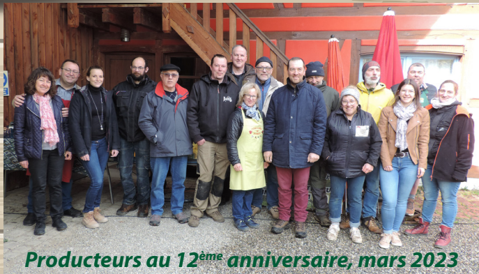
Producteurs au 12 ème anniversaire, mars 2023